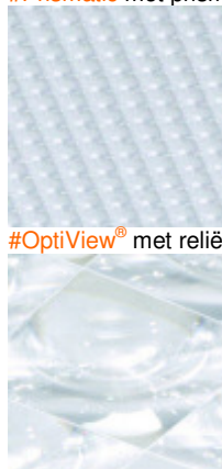
#OptiView® met reliëf voor een kristalheldere weergave