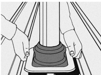
Schuif doorvoer over de pijp; gebruik evt. wat water als glijmiddel