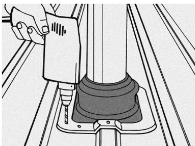
Bevestig doorvoer met zelfborende of zelftappende schroeven