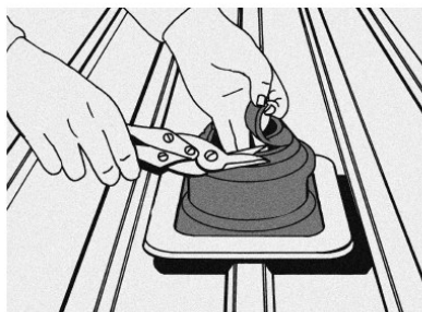
Knip conus af op de aangegeven pijpdiameter