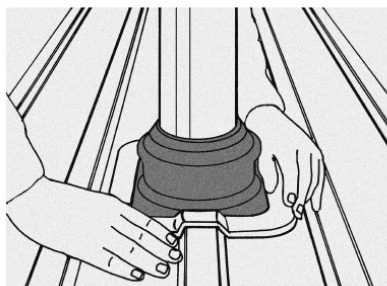
Buig bevestigingsrand in vorm dakprofiel